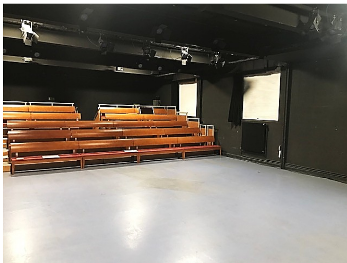
Salle en aménagement frontal

Zone de jeu d'environ 6 m de profondeur par 8 m d'ouverture