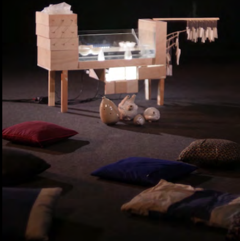
La boîte lumineuse, contenant le bassin d'eau et les différents instruments de musique et objets sonores conçus par Kapitolina Tcvetkova.