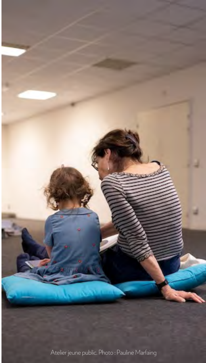
Atelier jeune public.