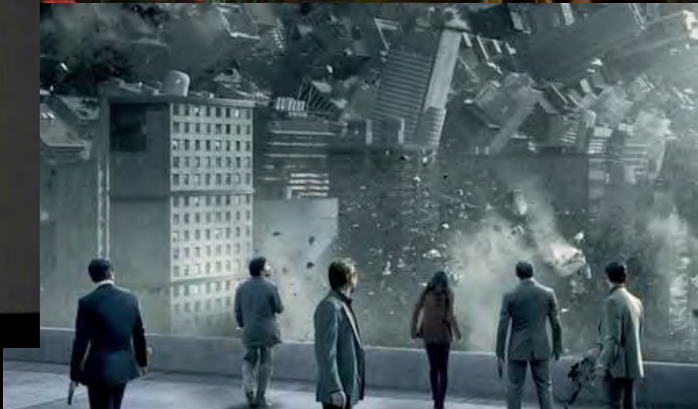
Images tirées des films Ghost Story , Les fraises sauvages , Vertigo , 2046 , Inception , Le Grand saut et de la série Counterpart