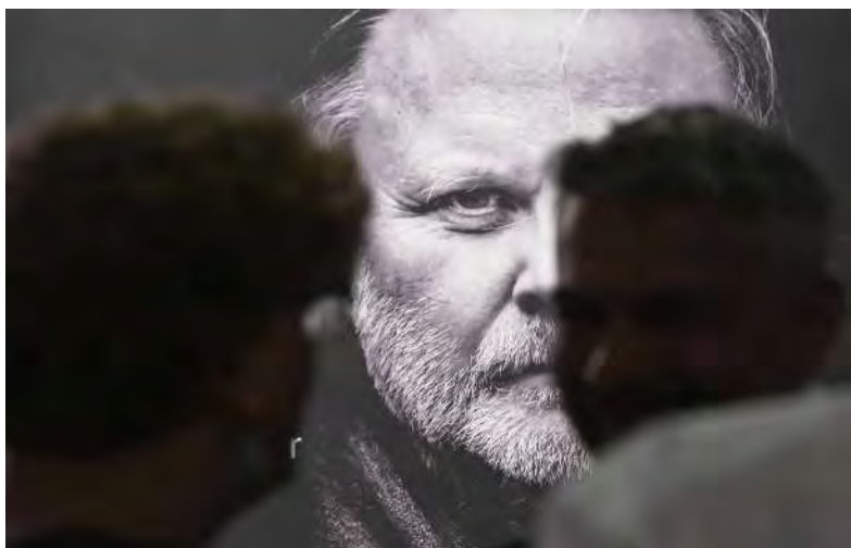
Une affiche de Jon Fosse, au salon du livre de Francfort (Allemagne), le 18 octobre 2023

Le metteur en scène parle en passionné et connaisseur de l'écrivain norvégien, qui reçoit ce dimanche à Stockholm le prix Nobel de littérature 2023.