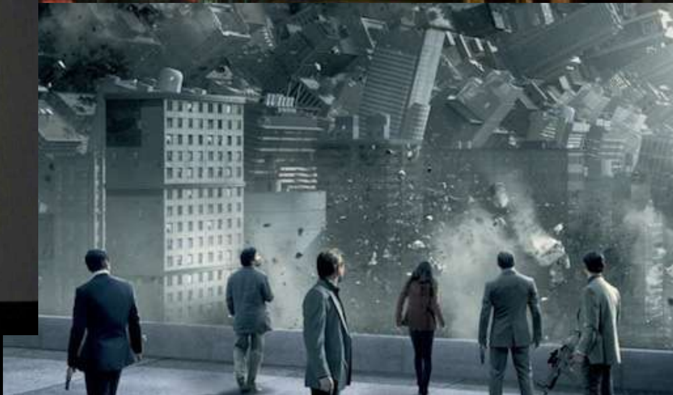
Images tirées des films Ghost Story , Les fraises sauvages , Vertigo , 2046 , Inception , Le Grand saut et de la série Counterpart