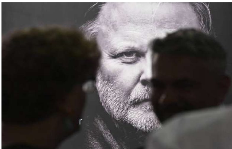
Une affiche de Jon Fosse, au salon du livre de Francfort (Allemagne), le 18 octobre 2023

Le metteur en scène parle en passionné et connaisseur de l'écrivain norvégien, qui reçoit ce dimanche à Stockholm le prix Nobel de littérature 2023.